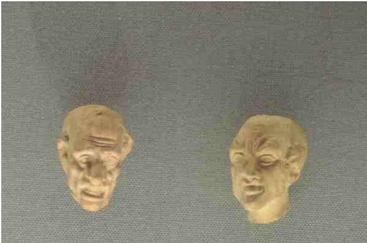
Russie

En examinant le contexte historique de la vie de Jésus de Nazareth, on peut constater que la société dans laquelle il vécut était également très instable, très conflictuelle, très polarisée, divisée non seulement entre les forces d'occupation, les Romains, et les peuples autochtones, mais aussi entre les Juifs eux-mêmes - une fragmentation totale. C'est donc de ce moment historique de l'incarnation de Dieu en Jésus que sont nés l'enseignement de l'Évangile et l'Esprit du Christ. La contemplation n'est donc pas réservée aux week-ends tranquilles ou aux samedis après-midi. Nous n'avons pas à réunir des conditions parfaites pour cela. Elle est en réalité le remède (...), la possibilité de guérir la rupture, la division de soi, la fragmentation, la polarisation des êtres humains entre eux et contre leur propre moi intérieur, et les uns contre les autres. Il existe une possibilité de guérir cela et de le dépasser, mais seulement si nous y faisons face et l'affrontons.