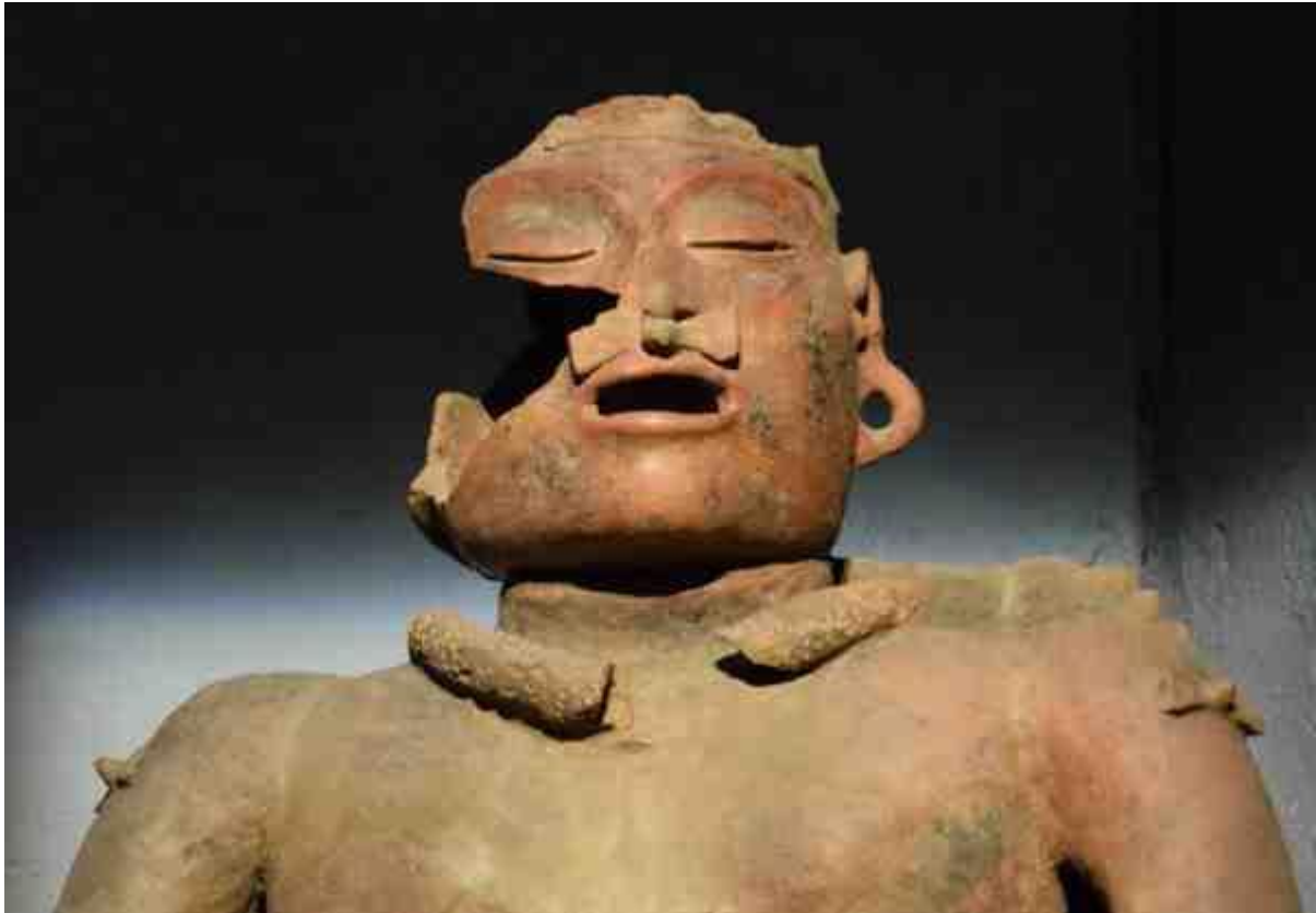
Mexique

Sur le plan culturel, la perte du mythe a été dévastatrice pour notre culture, et pour les jeunes en particulier. Ils sont devenus esclaves des réseaux sociaux. Et leurs parents et grands-parents les ont très vite suivis. Cela étouffe le dialogue ; l'exemple d'échanges civilisés, informés et respectueux est plutôt rare dans les informations actuelles parmi nos dirigeants. Les algorithmes des médias sociaux se sont emparés de nous. (...) Le problème, c'est qu'il s'agit d'une force générée qui rapporte énormément d'argent et qui ne se contente pas de nous influencer, elle nous façonne. Quel est donc le remède à cela, à cette perte de la sagesse contemplative, du langage commun et des histoires ? Comme nous ne pouvons pas vivre sans mythes, nous en inventons : *Star Trek* , *Harry Potter* , *Star Wars* , Le Seigneur des anneaux* . Ils nous donnent de quoi travailler. Ce sont des mythes mineurs, mais avec lesquels on peut travailler, il est vrai, mais ils sont dominés par le consumérisme et le mercantilisme. Il n'y a pas de grand mythe sur la mort dans notre culture moderne, je ne pense pas, pas de tragédie. On ne peut pas créer une tragédie, diraient beaucoup de gens, sans que la question d'un « dieu » ne soit au cœur du débat, ne serait-ce qu'en tant que question. Nous sommes dans une situation critique sérieuse.