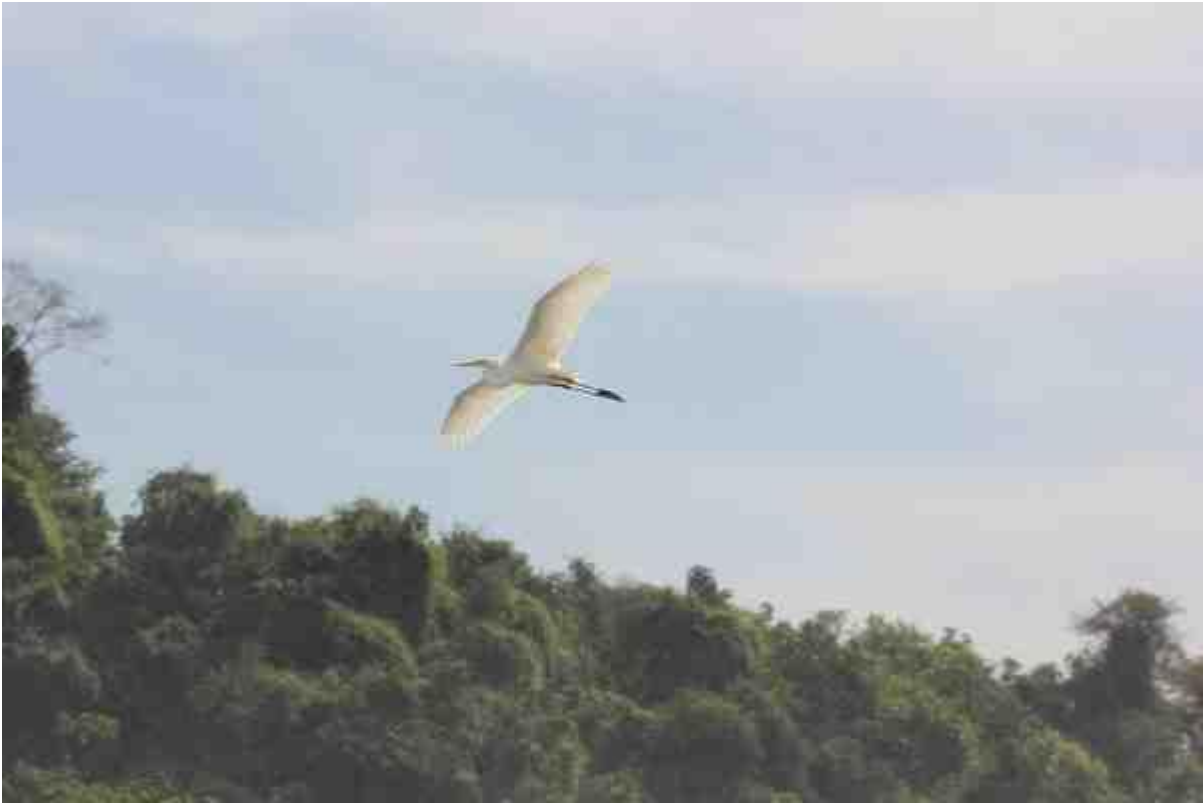
Caraïbes

Je parlais de la contemplation et de notre soif de contemplation, de renouvellement, d'une vision nouvelle du monde, d'une nouvelle façon de prioriser les éléments de notre vie, d'y mettre de l'ordre, d'y ramener l'émerveillement, la profondeur, la justice et la paix, dans un monde et une culture qui paraissent de plus en plus détruits. Nous avons soif de contemplation comme source suprême de sagesse. Suprême parce que Dieu est dans la contemplation, Dieu est contemplatif.