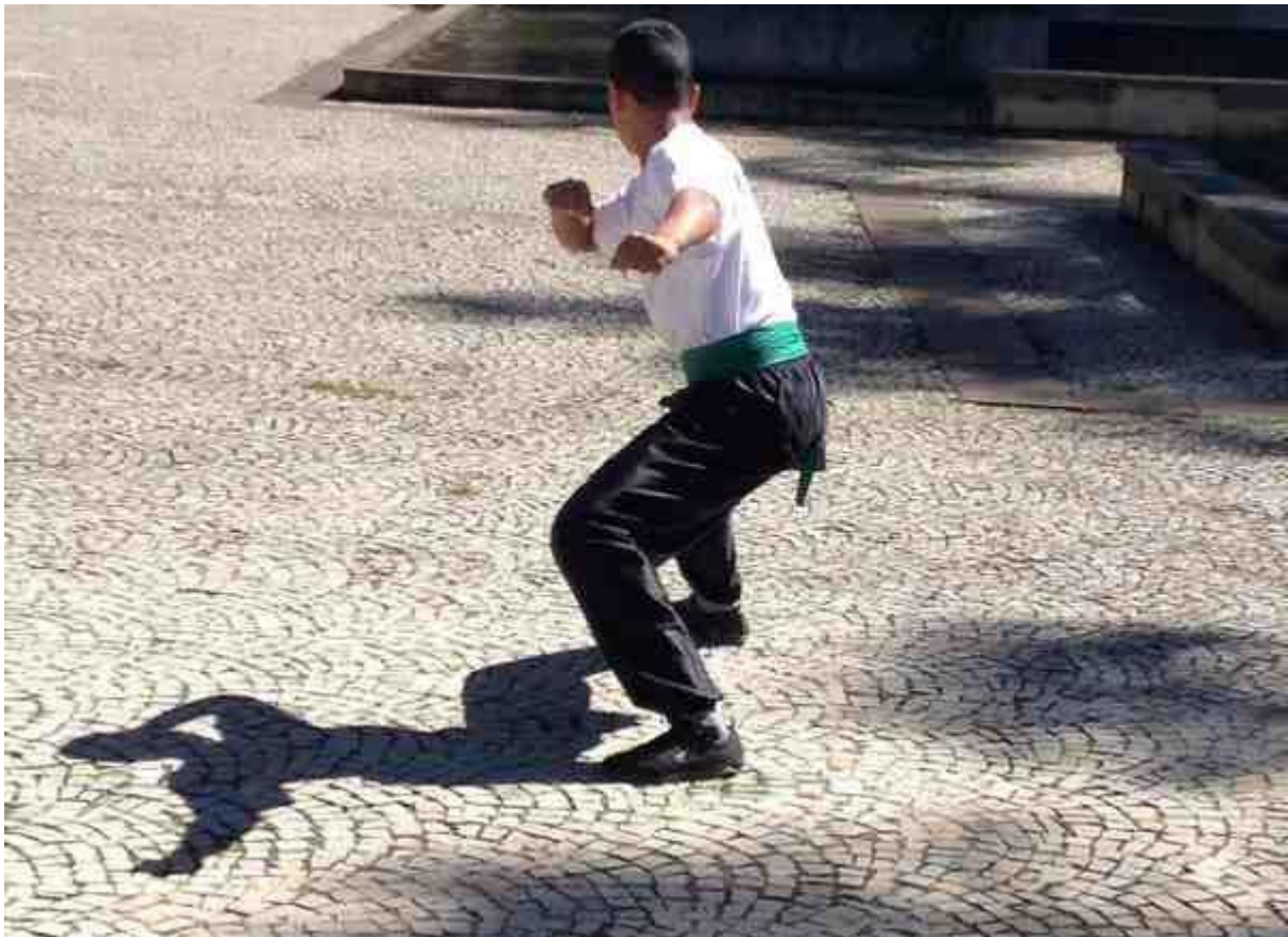
Brésil

Nous devrions aller à la recherche des sources de sagesse, plutôt que de nous plaindre de la gravité de la situation. Nous devrions rechercher ces sources de sagesse et les relier les unes aux autres. Car chacune de ces sources puise sa sagesse dans un corps de sagesse sous-jacent unifié, dans l'eau qui est la sagesse de l'Esprit.