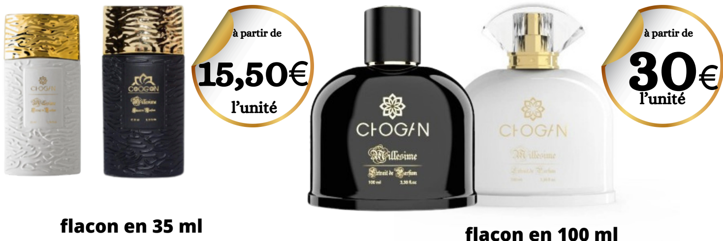
flacon en 35 ml