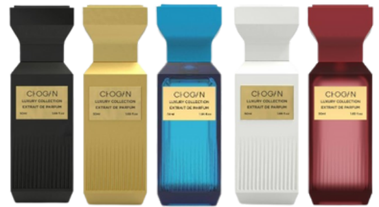
flacon en 50 ml