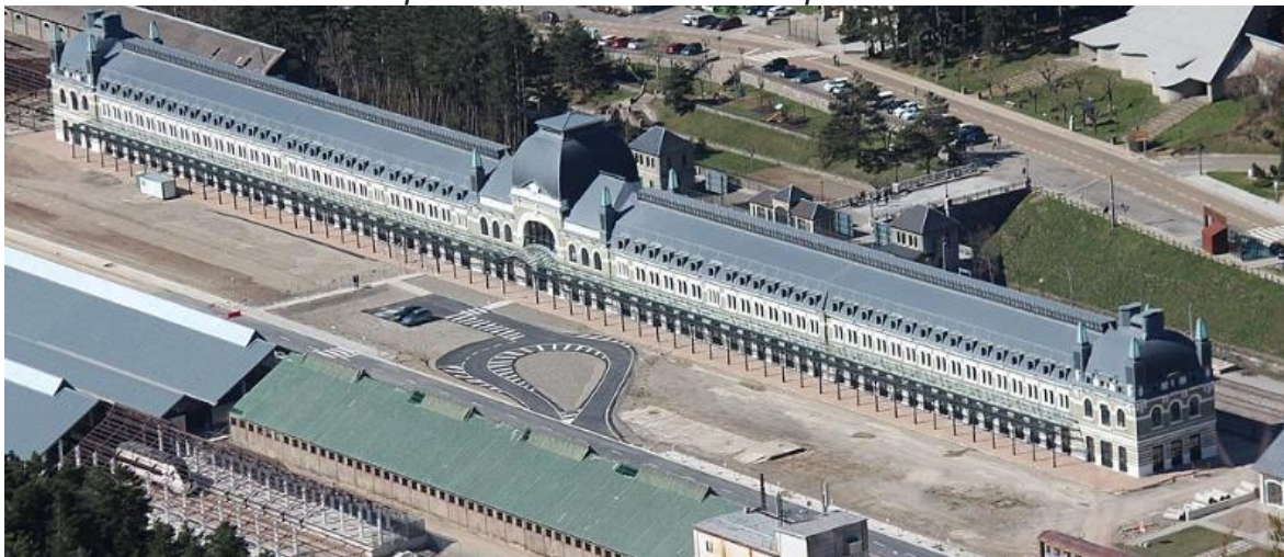
La gare internationale de Canfranc

En septembre 2024, le Ministère des Transports publiait une étude estimant à 93 millions d'euros le coût de la réhabilitation et de la réouverture du tunnel ferroviaire (le retrait du revêtement, l'élargissement du tunnel dans la roche, la pose d'un nouveau revêtement, la pose de la plateforme, de la voie et de la caténaire, la pose des équipements de ventilation et de sécurité) pour une durée des travaux de 52 mois. Mais quid du tunnel de secours prévu dans la concession ?