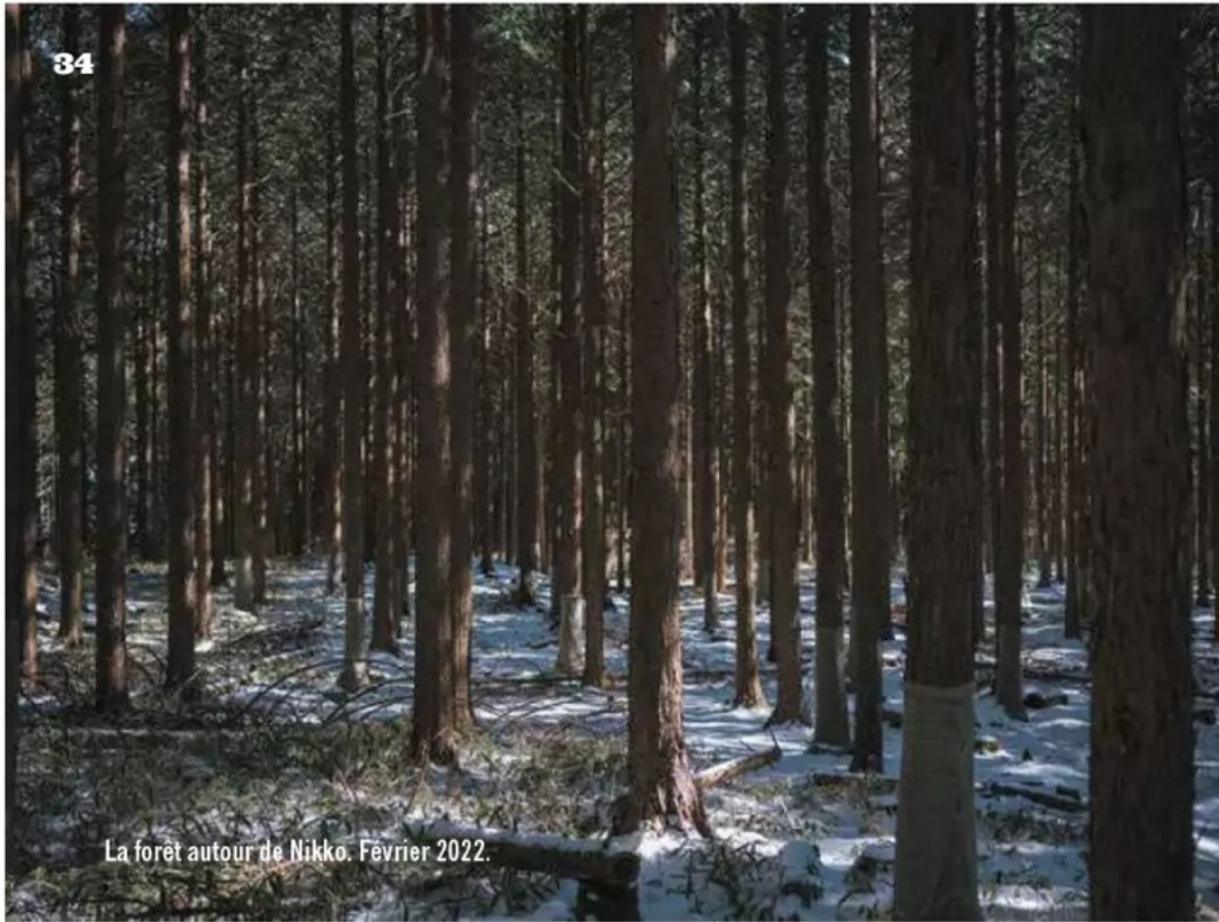
La forêt autour de Nikko. Février 2022.

en électricien avec bottes, vêtements et faux permis de travail. Ses tiroirs dégueulent un stylo caméra, des talkies-walkies, et surtout huit caméras Sony de toutes tailles, afin de les dissimuler à sa guise dans n'importe quoi –un faux extincteur, un boîtier électrique fantôme, une horloge creuse. À l'aide d'un petit objectif conique, il peut ensuite rediriger la lentille à travers un trou pas plus grand qu'une punaise. K. aime installer des micros, aussi. Pour capter leur signal, il doit être dans un