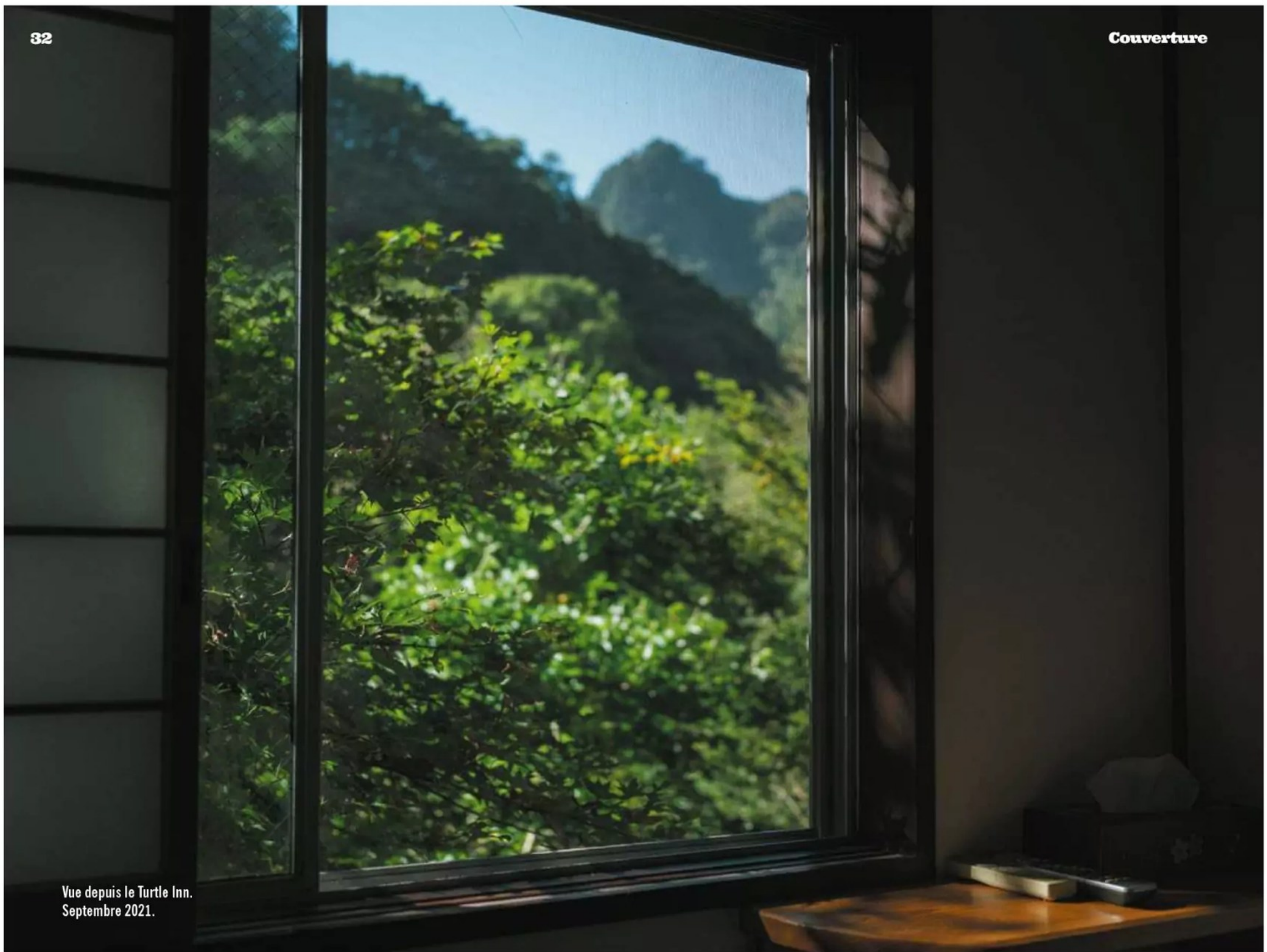
Vue depuis le Turtle Inn. Septembre 2021.

aujourd'hui recouvert par de hautes herbes. Sous un pont se dressent un tas de cartons, quelques sacs en plastique noirs et deux valises. Deux policiers sont envoyés sur place pour un contrôle de routine. En s'approchant, ils sont saisis par une odeur de pourriture et des effluves "métalliques" qui émanent d'une valise argentée à roulettes, 70 centimètres de haut, 60 de large, 30 de profondeur et légèrement entrouverte. Ils font lentement glisser la fermeture. À l'intérieur, roulé dans une bâche en plastique, les deux officiers découvrent un torse humain coupé au niveau des hanches, couvert de croûtes de sang séché et dont on a amputé la tête et les bras. En levant la tête, le souffle haletant, ils aperçoivent la deuxième valise, posée un peu plus loin. Les policiers s'y dirigent en se bouchant le nez. L'odeur est abominable. Sous trois couches de plastique et de carton, ils retrouvent le bassin, un couteau-scie et la tête, frappée si brutalement qu'elle a gonflé comme un ballon de baudruche. À 400 mètres de là, à l'endroit où les golfeurs tapaient autrefois leurs putts sur un somptueux green, des morceaux de chair débordent d'un sac de sport coloré, dont l'autopsie révélera qu'ils proviennent de la taille de la victime. Le médecin légiste renseigne rapidement la famille Véron sur un élément important: là non plus, ce n'est pas Tiphaine. En revanche, le défunt, un homme entre 40 et 70 ans, de groupe