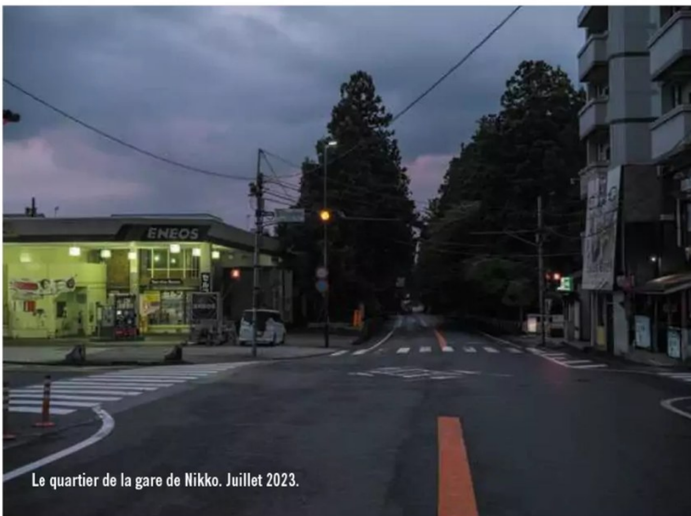
Le quartier de la gare de Nikko. Juillet 2023.