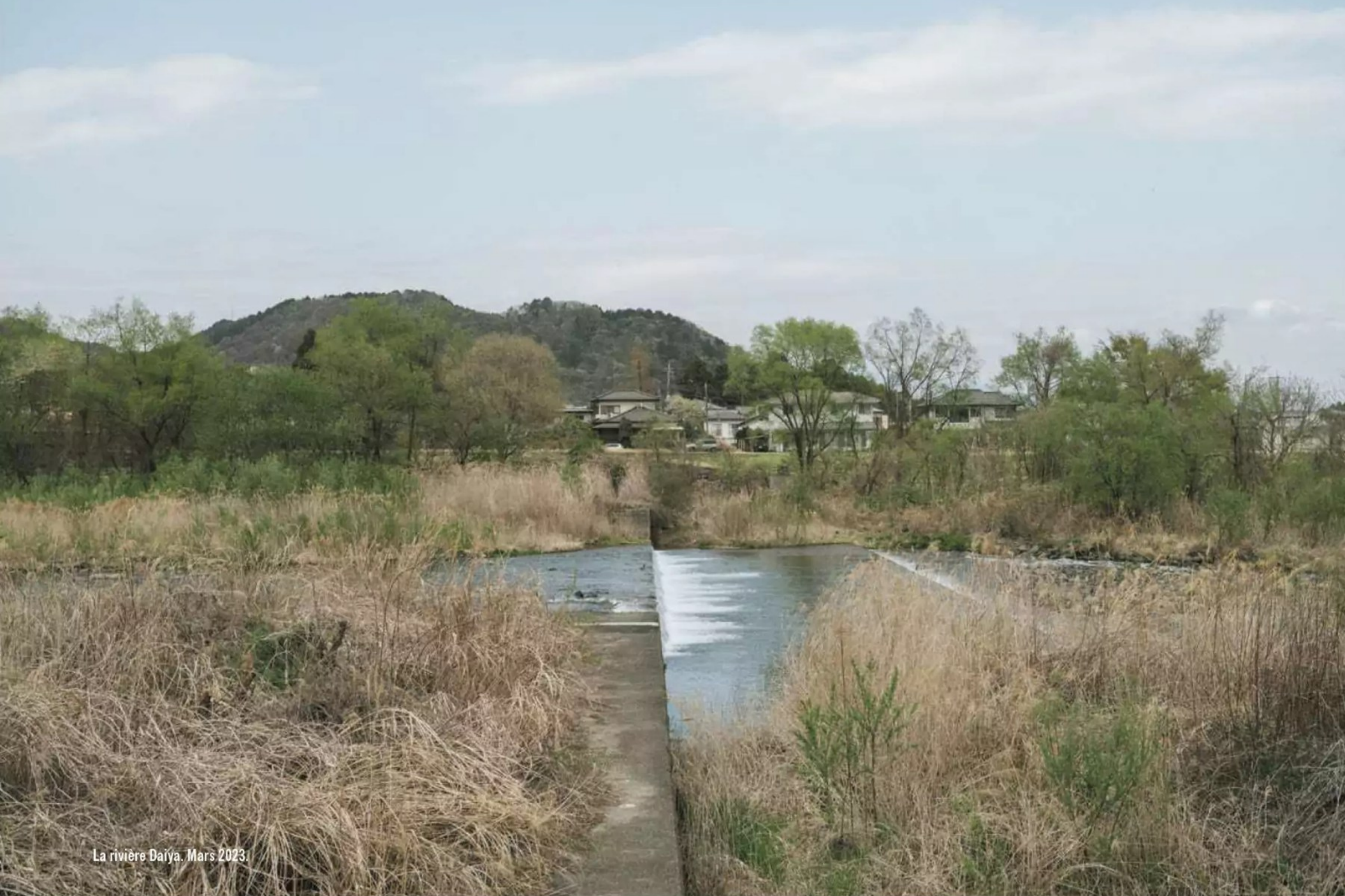
La rivière Daiya. Mars 2023.

À 11h25, même après que les points GPS de son appareil se sont éteints bizarrement, son historique montre qu'elle utilise son convertisseur de devises puis, à 11h34, regarde un itinéraire pour se rendre du Turtle Inn à un site touristique situé juste à côté, dans les bois, l'abysse de Kanmangafuchi. Et enfin: