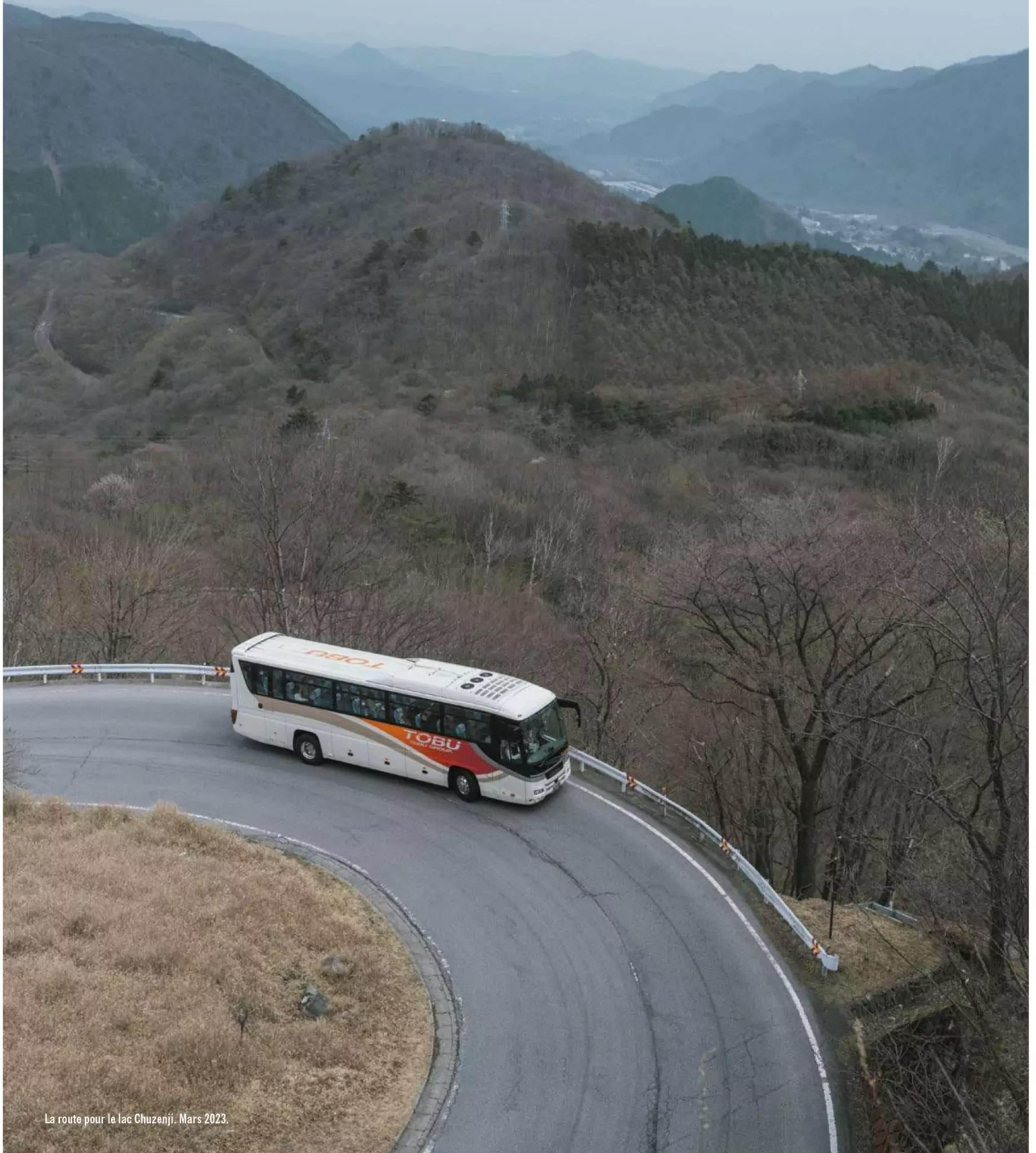
La route pour le lac Chuzenji. Mars 2023.