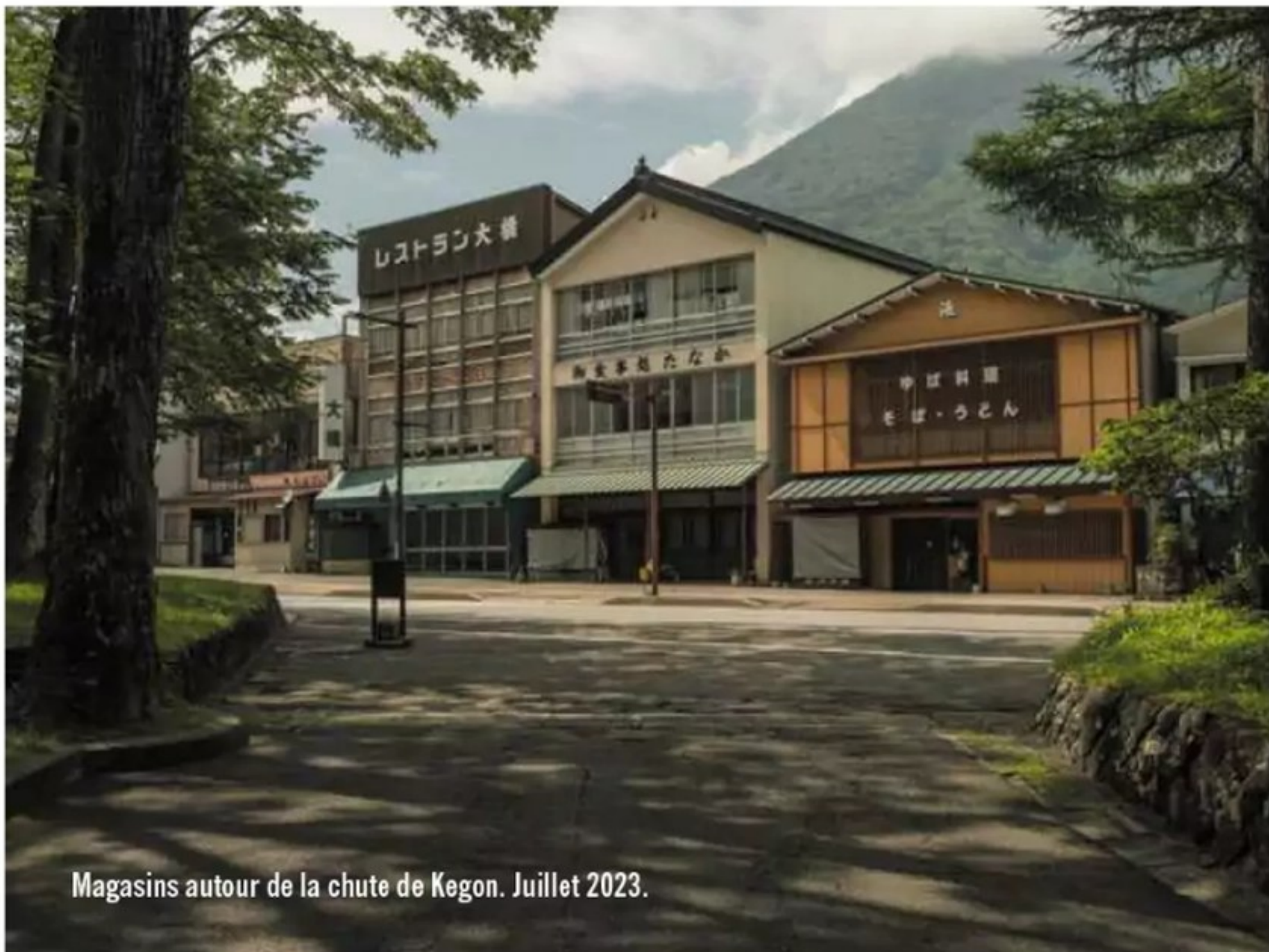
Magasins autour de la chute de Kegon. Juillet 2023.