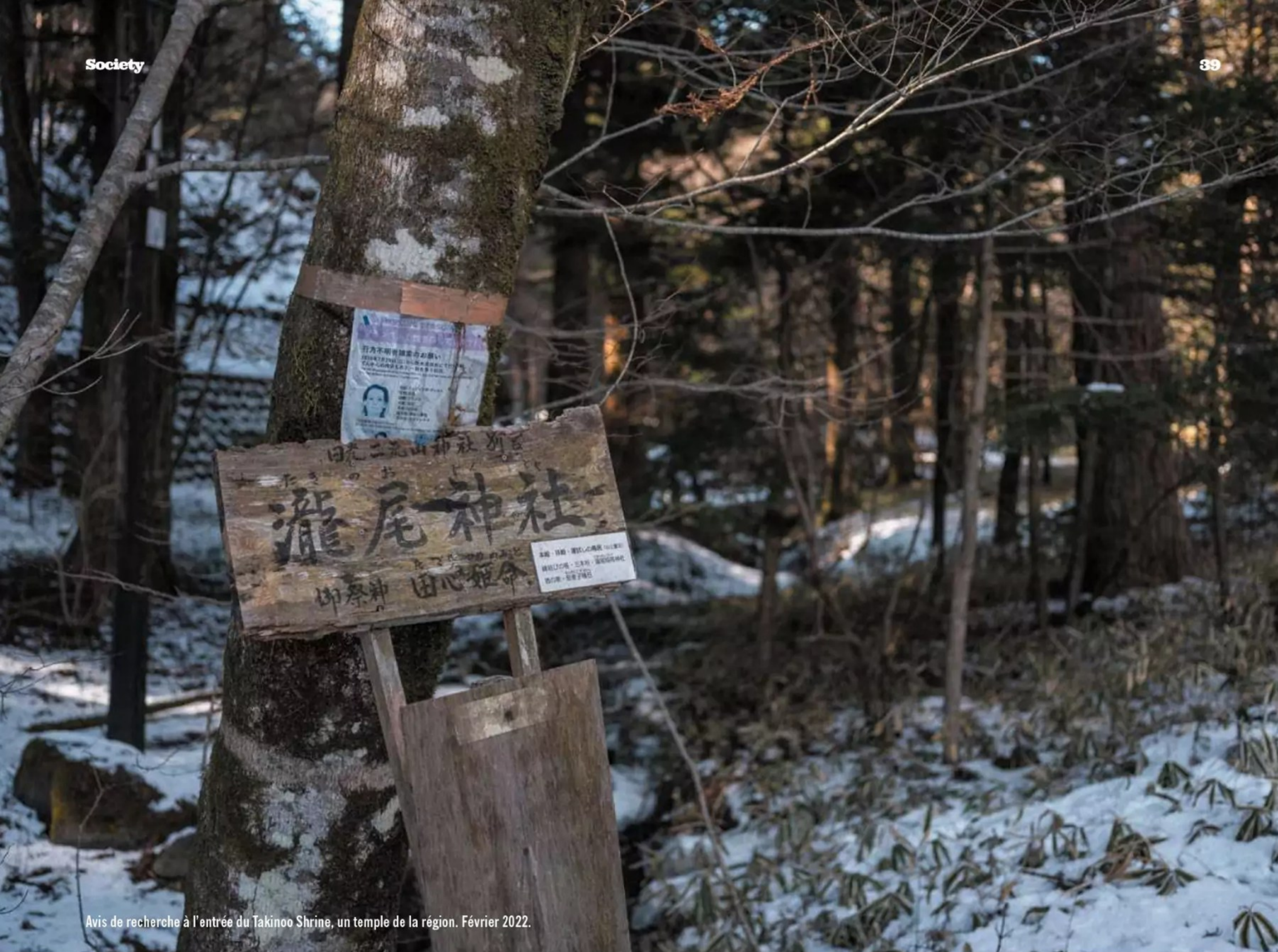
Avis de recherche à l'entrée du Takinoo Shrine, un temple de la région. Février 2022.