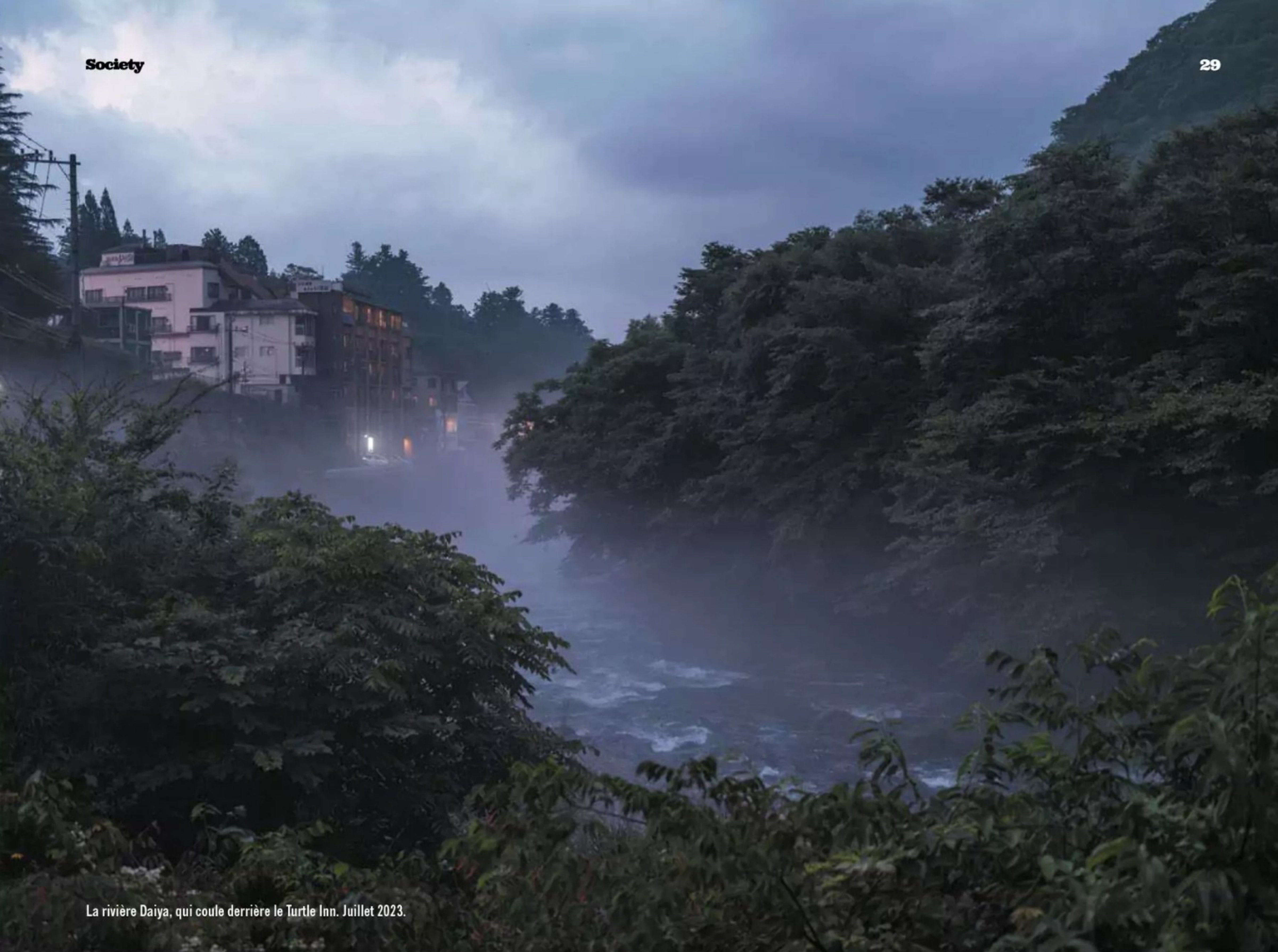
La rivière Daiya, qui coule derrière le Turtle Inn. Juillet 2023.