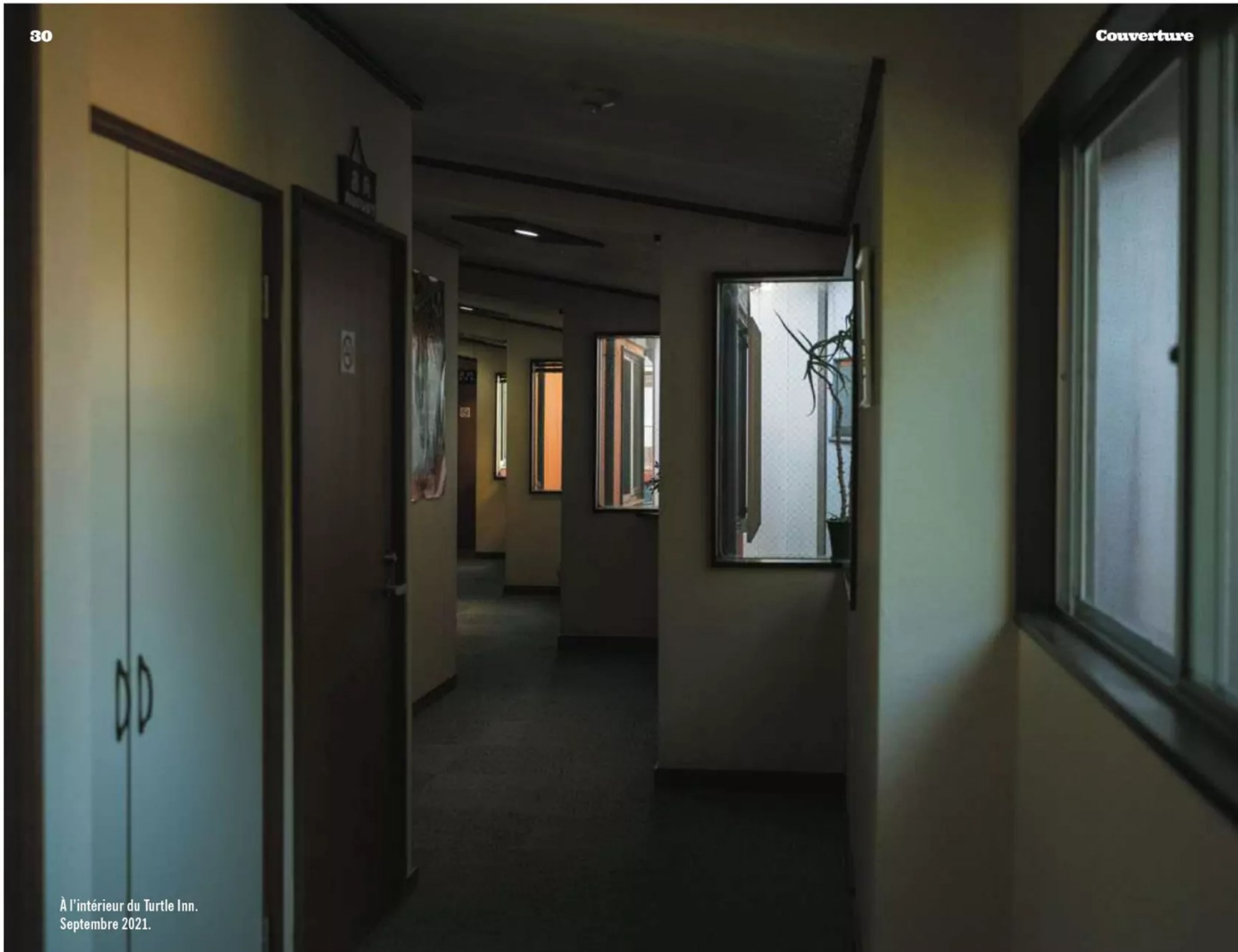
À l'intérieur du Turtle Inn. Septembre 2021.