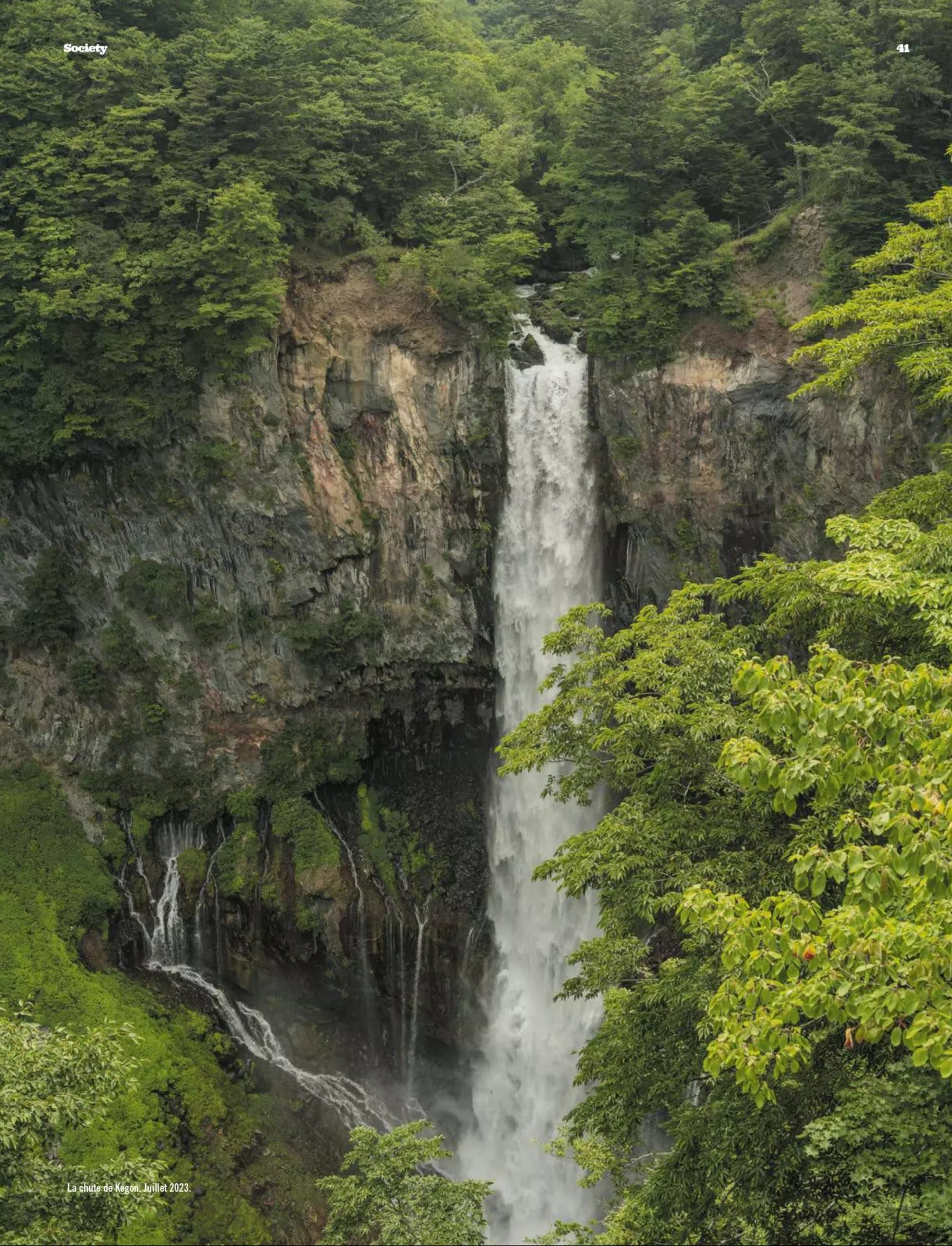
La chute de Kégon. Juillet 2023.