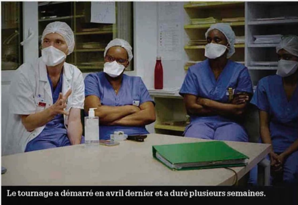
Le tournage a démarré en avril dernier et a duré plusieurs semaines.