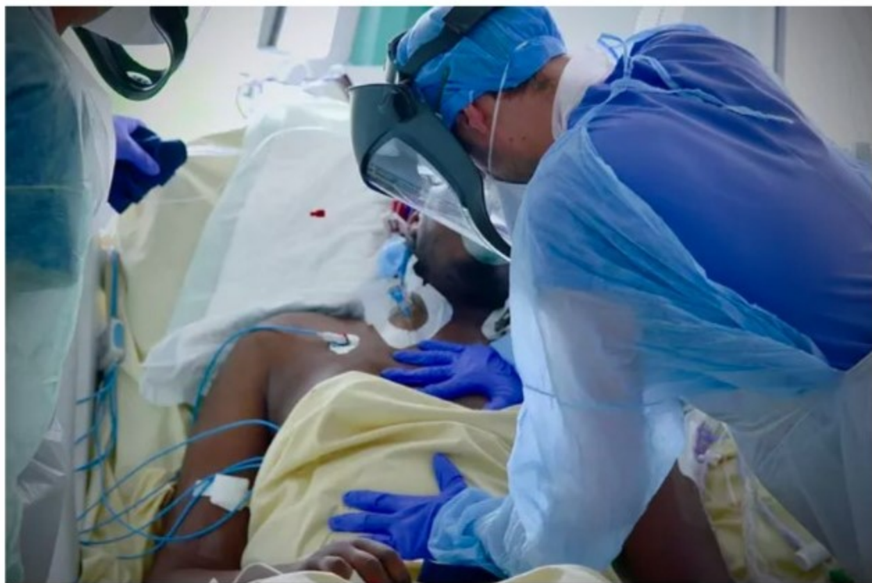
Photo prise à l'hôpital de la Pitié-Salpêtrière AP-HP.