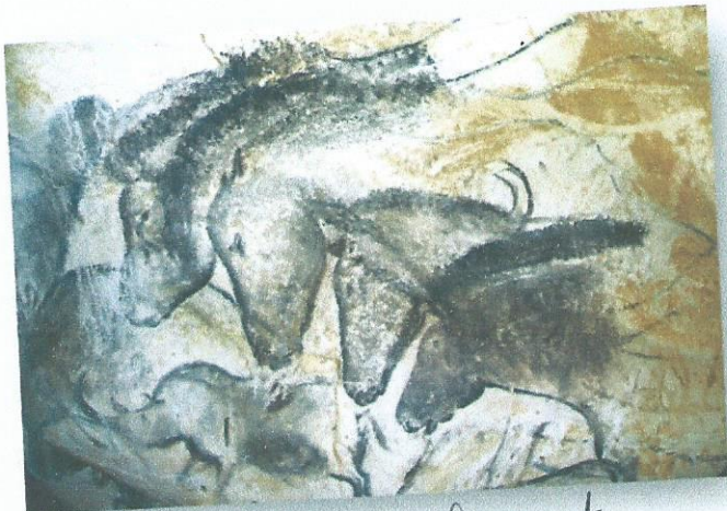
La grotte Chauvet

En France, il est possible de visiter les répliques de deux grottes préhistoriques célèbres : la grotte de Lascaux en Dordogne et la grotte Chauvet en Ardèche.