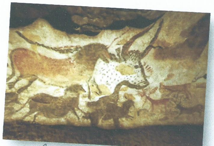
La grotte de Lascaux