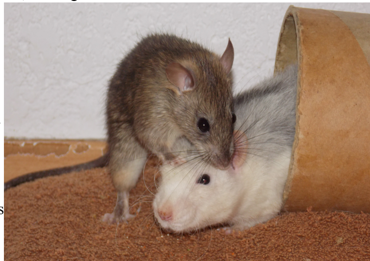
Imagine ( rattus rattus ) en compagnie de LVM Syo ( rattus norvegicus , rat domestique). Deux rats d'âge similaire.

La domestication du rat brun aurait débuté en Angleterre, patrie d'un jeu nommé « rat baiting » dans lequel un chien de chasse devait tuer en un temps limité le plus grand nombre possible de rats à l'intérieur d'une arène. Il s'agissait d'un jeu très populaire au XIXe siècle, si bien que rapidement la simple capture des rats sauvages ne permettait plus de « fournir » les arènes. L'idée de l'élevage serait apparue. On suppose que ce fut l'apparition de sujets