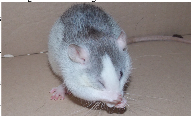
LVM Kismi Honey en pleine toilette

Nous avons vu (Deuxième partie, chapitre 2) le toilettage mutuel et sa signification. Voici la rubrique concernant le toilettage individuel. Le rat passe approximativement 40% de son temps d'éveil à faire sa toilette. Cette dernière suit un ordre particulier. Le rat commence par se mettre en position assise, sur ses pattes arrières. Il débute par le nettoyage de ses pattes avant puis les passe sur son visage. Dans un second temps, il s'occupe de ses flancs et de son dos en faisant de grands cercles. Ses parties génitales arrivent dans un troisième temps, puis la queue. Certains rats sont plus attentifs à leur hygiène que d'autres.