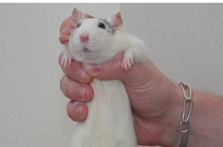
LVM Eternal Sunshine, manipulée "par au-dessus"

Tout d'abord, voyons comment ne pas manipuler un rat : ne prenez jamais un rat par la queue. C'est