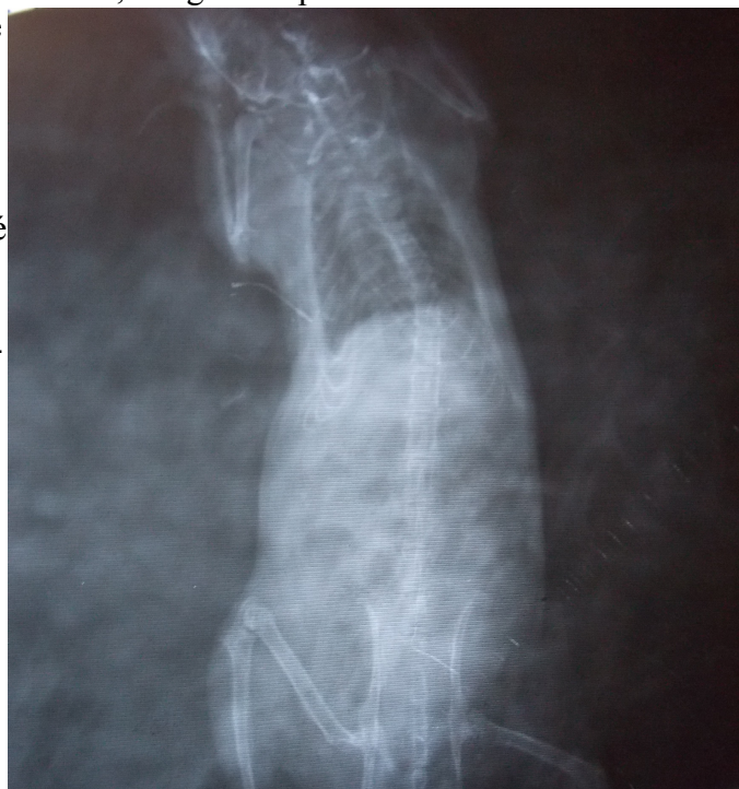
Radio de INC Peek-a-Boo pour détecter une fracture

Si vous tenez à proposer une roue à vos rats, choisissez-la pleine et non pas à barreaux et de diamètre adapté.