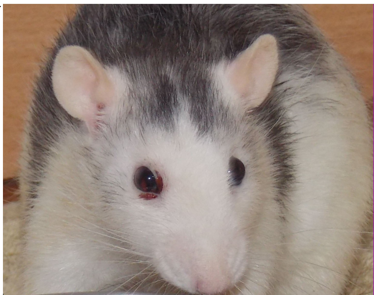
LVM Eternal Sunshine présente de la porphyrine à l'oeil droit

Il est normal de voir parfois son rat avec un peu de porphyrine autour du nez et des yeux, surtout au réveil. Cependant, lorsque le rat ne va pas bien, la glande de Harder s'irrite et produit un excès de porphyrine qui s'accumule en paquets autour du nez et des yeux. C'est un signal d'alerte chez tout propriétaire : quelque chose ne va pas ! Il peut s'agir d'une litière ou d'une nourriture non adaptées, un stress important ou bien sûr une maladie.