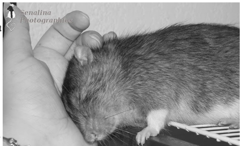
LOS What Else? et moi, une histoire d'amour

Malheureusement, le rat ne saurait être parfait pour autant. Il faut tout d'abord prendre en compte son espérance de vie limitée (de 2 ans à 2 ans et demi), et la souffrance que peut représenter la perte d'un animal avec lequel on peut créer une relation étroite mais qu'on doit quitter si vite... De plus, la