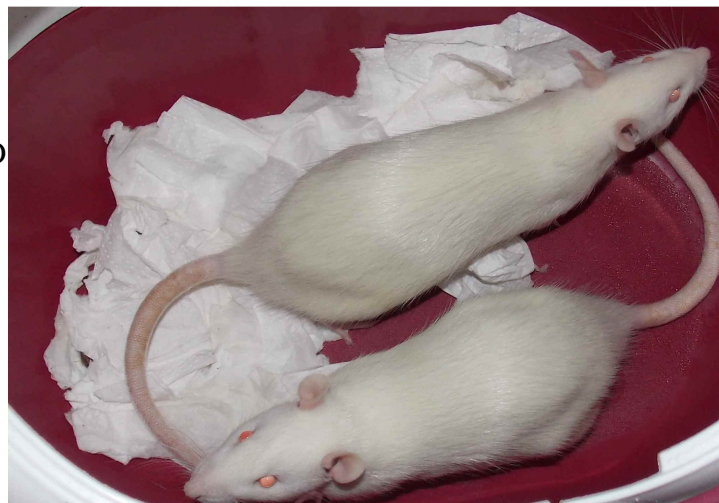
Rats de laboratoire de souche Wistar