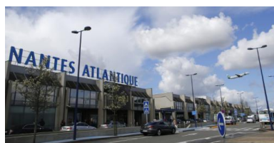
L'aéroport de Nantes-Atlantique

PAR CHRISTOPHE GUEUGNEAU ET JADE LINDGAARD ARTICLE PUBLIÉ LE MARDI 12 DÉCEMBRE 2017