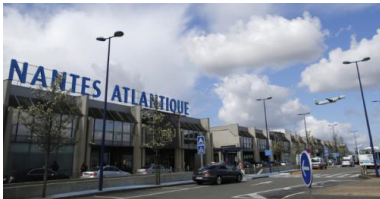
L'aéroport de Nantes-Atlantique

L'autre piste étudiée serait de créer une nouvelle piste qui couperait la première en formant un angle droit. « Cette hypothèse imposerait l'acquisition de plus de 200 ha de foncier et conduirait à une redistribution des équipements et des infrastructures sur la plateforme », écrit la DGAC.