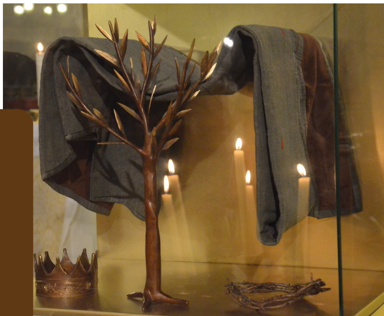
Le manteau de saint François sera exposé.

20h30 : Veillée pour "essuyer les larmes" . Reprenant l'initiative du Pape François (5 mai 2016 à Rome), les franciscains proposent une veillée pour trouver la consolation et déposer nos fardeaux. Témoignages, prières, lectures bibliques et intentions seront portées au pied de la Croix.