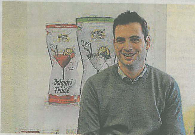
Cet entrepreneur rezéen propose le premier cocktail granité surgelé.

Ses sachets sont commercialisés dans trois enseignes (Leclerc, Carrefour, Hyper U) depuis avril 2017. Ils sont