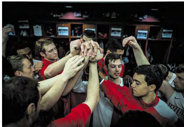
Ci-dessus : Dans le vestiaire de l'équipe des Wildcats, à Marion (Indiana).