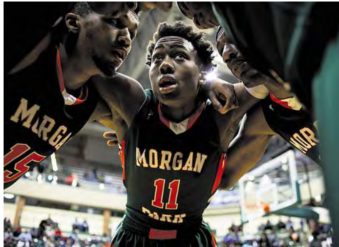
Ci-contre : Finale de la ligue des lycées publics à Chicago. Les joueurs de Morgan Park affrontaient ceux de Simeon, sponsorisés par Nike. Ci-dessous : Avant tous leurs matchs, les Wildcats de l'Université wesleyenne d'Indiana font une prière.

Avec près de trente millions de joueurs occasionnels, le basket-ball compte parmi les sports les plus populaires aux États-Unis. Selon qu'il est pratiqué sur le parquet des Chicago Bulls, dans les rues d'un ghetto noir ou dans l'université d'une petite ville de l'Indiana, il revêt des fonctions sociales très disparates.