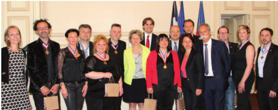
Les lauréats 2015 du Concours “Un des Meilleurs Ouvriers de France” et l'équipe de l'UNEC à la mairie du 9 e arrondissement de Paris.

Directement sur le site www.meilleursouvriersdefrance.org