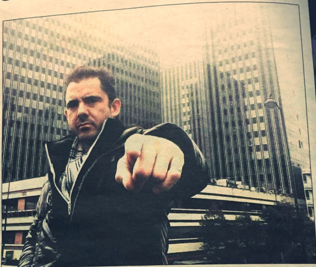
Le rappeur d'origine toulonnaise vient de sortir un 17 titres : L'ombre et la proie .

Après tout ce temps, L'ombre et la proie , 17 titres, sorti en septembre dernier apparaît comme son plus important projet solo. Ses thèmes sont universels : comment exister, se battre,