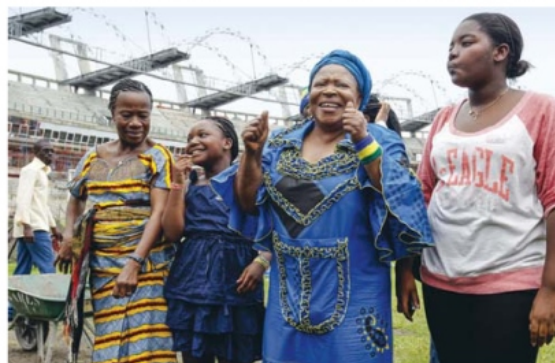
PATIENCE DABANY , anciennement Joséphine Bongo, ici en 2012.