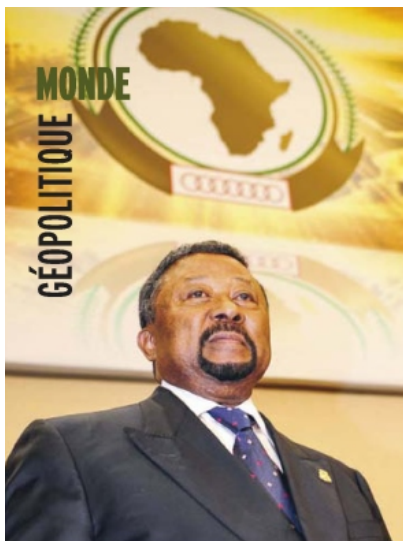
JEAN PING, l'ex-président de la commission de l'Union africaine, longtemps lié au clan Bongo, qualifié désormais le régime gabonais de "dictature".