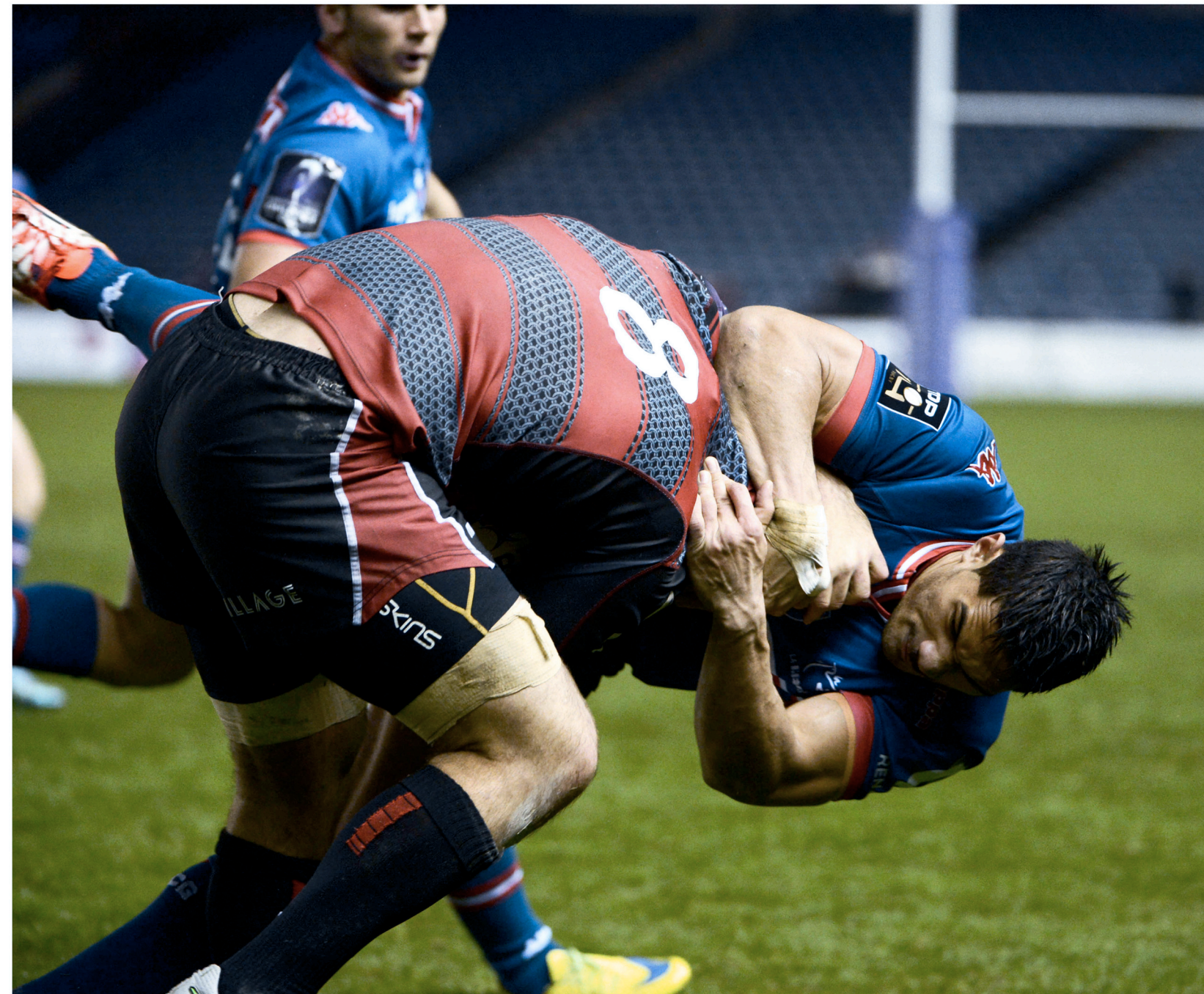
Bataille féroce au niveau des plaquages.

Dès le coup d'envoi, les Écossais se lancent à fond dans la rencontre et occupent très vite le camp des Alpains. Ils marquent un essai au bout de trois minutes à la suite d'un groupé -pénétrant parfaitement orchestré qui n'a pas pu être stoppé par une défense grenobloise cueillie à froid. Après cette entame délicate, le jeu s'équilibre. La défense alpine est agressive et très bien en place. Les joueurs grattent des ballons dans les rucks, lancent des contre-attaques de loin, mais gâchent malheureusement les occasions par des fautes de main dans la finition. Le score reste figé longtemps en faveur des Écossais qui mènent 5 à 0.