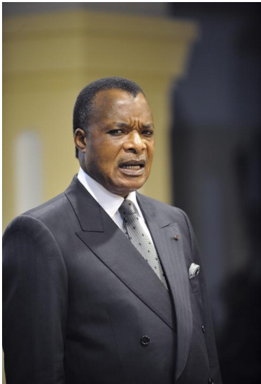
Denis Sassou Nguesso, l'homme fort du Congo-Brazzaville depuis 1997.

C'est une promenade policière dans le Paris du luxe qui donne la nausée. Les enquêteurs de l'Office central pour la répression de la grande délinquance financière, en charge des différents volets de l'affaire dite des « Biens mal acquis », sont parvenus à établir dans le détail les indécentes dépenses « shopping » du président du Congo-Brazzaville, Denis Sassou Nguesso, et de sa famille.