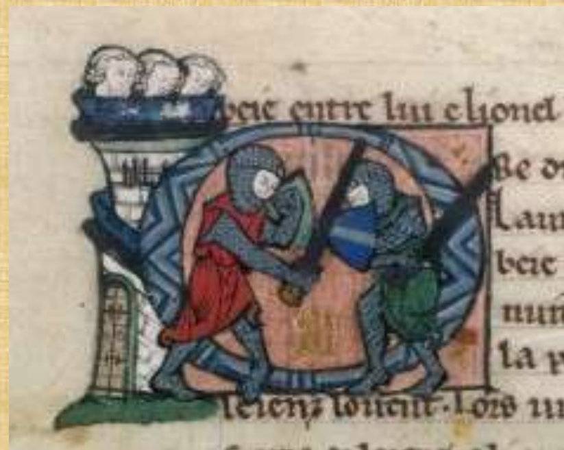
Combat de Lancelot et de Bohurt l'Essilié, France, 1275.