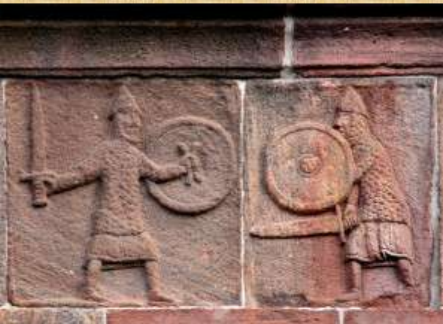
Bas relief de la basilique d'Andlau, Alsace, fin XIIe siècle (vers 1170 ?)