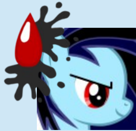
Skyeril « Le Docteur »