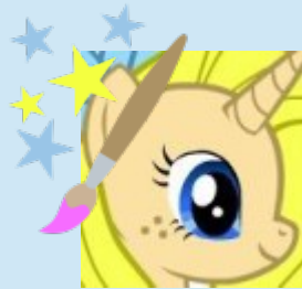
Louviaa « La Perfectionniste »