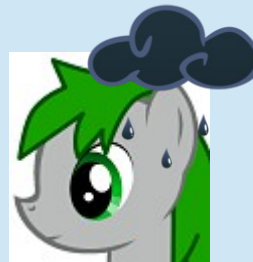
Grumpy Green « Le Scribe »

« Une étude qu'un simple ne comprend pas, est une mauvaise étude » Grumpy Green