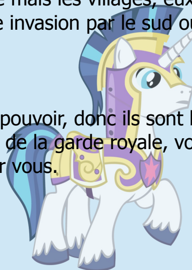
* Shining Armor *

Car il y a : Général (Alicorne) Capitaine (Shining Armor) Soldat (les gardes)