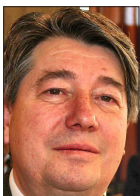
ALAIN GUINOISEAU DÉLÉGUÉ NATIONAL À LA REFORTE DES COLLECTIVITÉS LOCALES