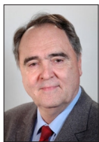
HENRI TEMPLE DÉLÉGUÉ NATIONAL À L'INDÉPENDANCE DE LA FRANCE