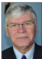
JEAN-PAUL BAGOT DÉLÉGUÉ NATIONAL AUX FRANÇAIS DE L'ÉTRANGER