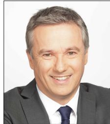
NICOLAS DUPONT-AIGNAN PRÉSIDENT