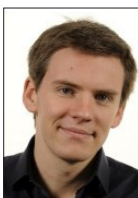
JEAN-BAPTISTE RAPHANAUD DÉLÉGUÉ NATIONAL À LA RÉVOLUTION NUMÉRIQUE