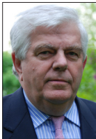
JEAN-PIERRE GÉRARD DÉLÉGUÉ NATIONAL À LA NOUVELLE FRONTIÈRE INDUSTRIELLE ET SCIENTIFIQUE