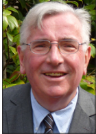
FRANÇOIS MORVAN DÉLÉGUÉ NATIONAL AU BIEN-ÊTRE ET À LA SANTÉ