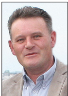
NICOLAS LOTTIN DÉLÉGUÉ NATIONAL À L'ÉQUILIBRE DES TERRITOIRES