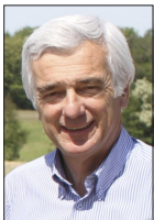
YVES GUILLOT DÉLÉGUÉ NATIONAL À L'ACCESSION À LA PROPRIÉTÉ