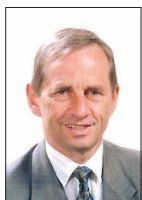
FRANÇOIS GUILLAUME DÉLÉGUÉ NATIONAL AU PARTENARIAT AVEC L'AFRIQUE ET LA MÉDITERRANÉE