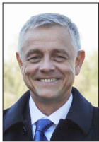
PATRICK MIGNON SECRÉTAIRE NATIONAL AUX ÉLECTIONS