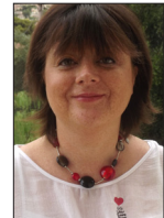
RACHEL ROUSSEL SECRÉTAIRE NATIONALE À LA FORMATION MILITANTE