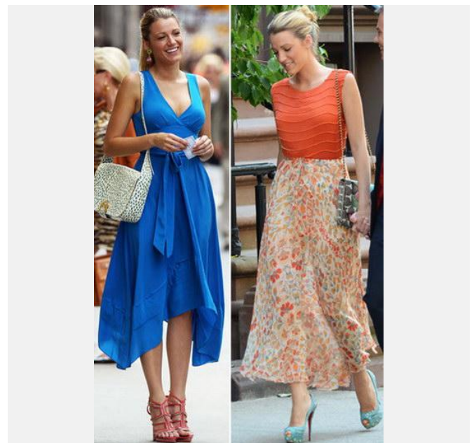
Et après, c'est Blake Lively. Deux façons de composer des blocs de couleurs avec les motifs. Vous l'avez appris ?

Si vous avez envie d'acheter des robes soirée, n'hésitez pas à visiter http://www.persun.fr/robe-de-soiree-c78/