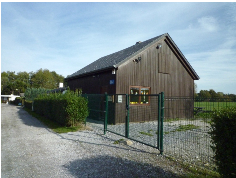
Le local communautaire géré par le Forum social, agent de concertation plan HP.