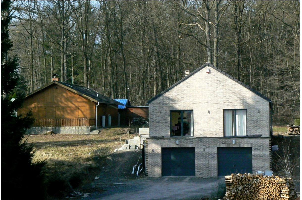
Maisons du Bois de Roly : Celle en brique a deux garages. Le plan HP est en application dans cette zone. Les gens en caravane quand ils le désirent bénéficient des aides au logement.