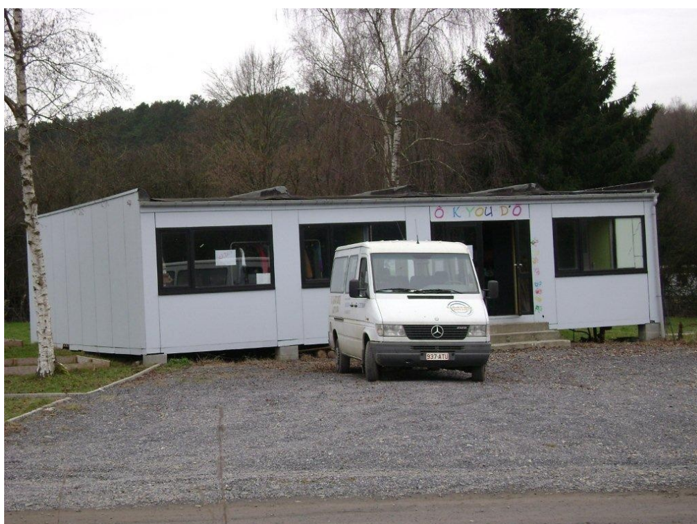
Le local communautaire du Caillou d'eau