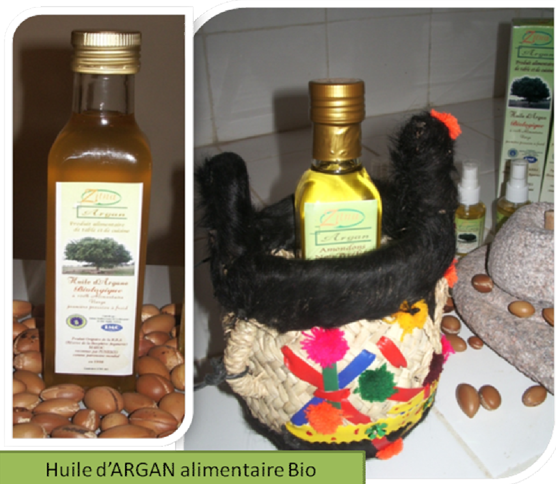
Huile d'ARGAN alimentaire Bio