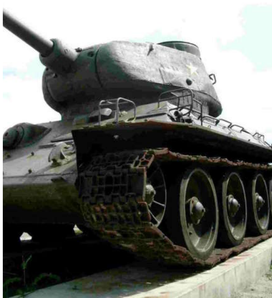
Le redouté char russe T 34 (Musée de l'Abri de Hatten).