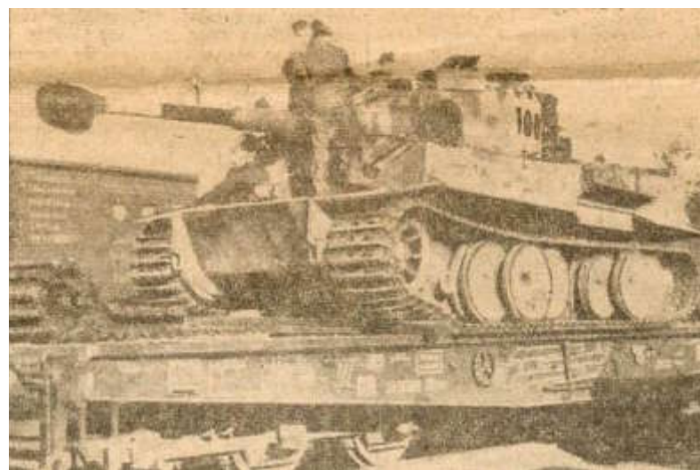
Char «Tigre» en Russie (photo paru dans les Strassburger Neueste Nachrichten du 26.11.1943).

Le 24 décembre, il est nommé caporal. «Le reste de la soirée constitue le Noël le plus triste de toute ma vie. Depuis plus d'un mois, je suis sans nouvelles des miens, libérés du joug nazi, et d'autre part, j'ai devant moi un avenir pour le moins incertain. Il ne faut pas oublier que je me trouve, revêtu d'un uniforme abhorré, dans une position des plus dés-