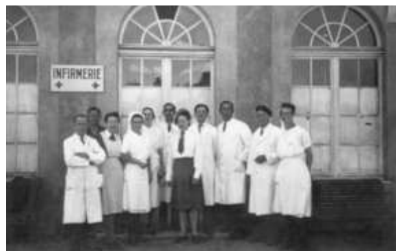
Centre d'accueil du Wacken à Strasbourg. (Coll. Koenig/Mengus)

nous a amené chez lui et nous a donné des pommes de terre cuites à l'eau. On était affamé. Heureusement qu'on avait de l'eau pour survivre. On cuisait beaucoup à l'eau: par exemple, 20 cavaliers, de différents escadrons, ont mangé 10 chevaux cuits à l'eau.