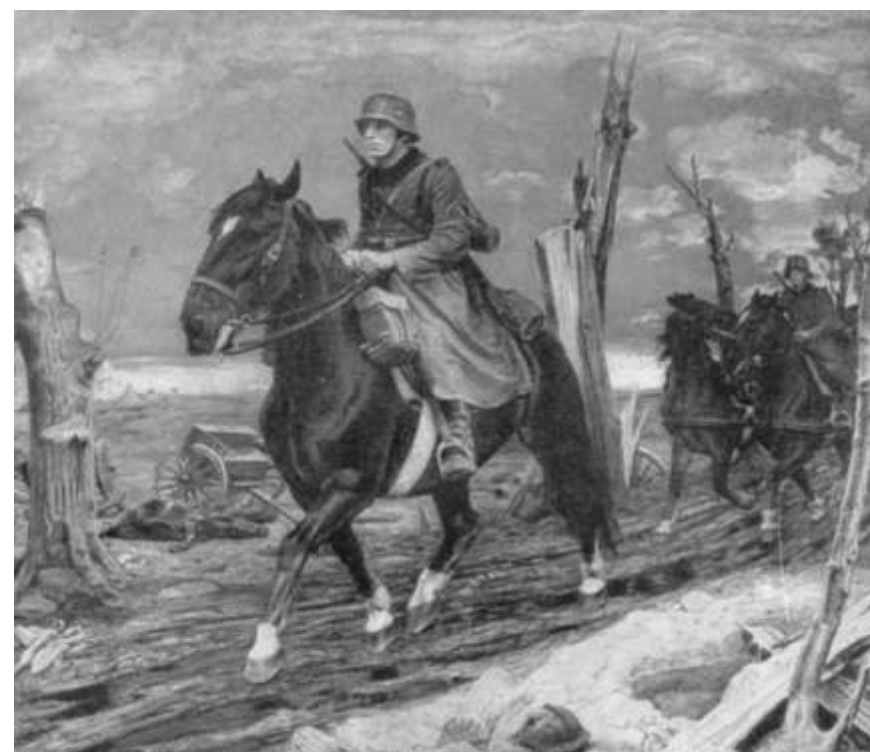
Cavaliers de l'Armée allemande.

Le 9 mai, il y avait encore beaucoup de neige dans les Alpes. Nous nous étions réfugiés dans une hutte de bûcheron. Un Autrichien