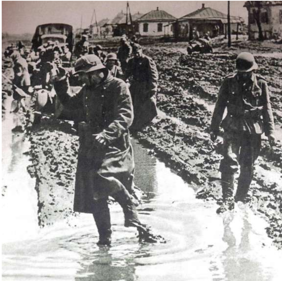
La boue du front russe (Photo extraite de l' Oberrheinischer Gaukalender 1943). (Coll. particulière)

gent. Il patauge dans la boue du matin au soir et a du mal à nettoyer ses bottes. Il regrette surtout de ne pas avoir de briquet pour allumer le feu ou les cigarettes (il s'est remis à fumer).