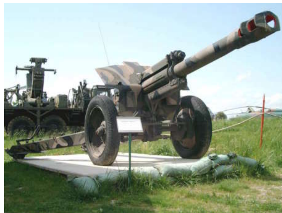
Obusier russe de 152 mm mis en service en 1936 (Musée de l'Abri, Hatten).

Avec l'été, de nombreux camarades tombent malade (typhus, malaria...). Il souffre de faim et manque de soins. Il a connaissance, le 9 juin 1944, du débarquement des Alliés dans