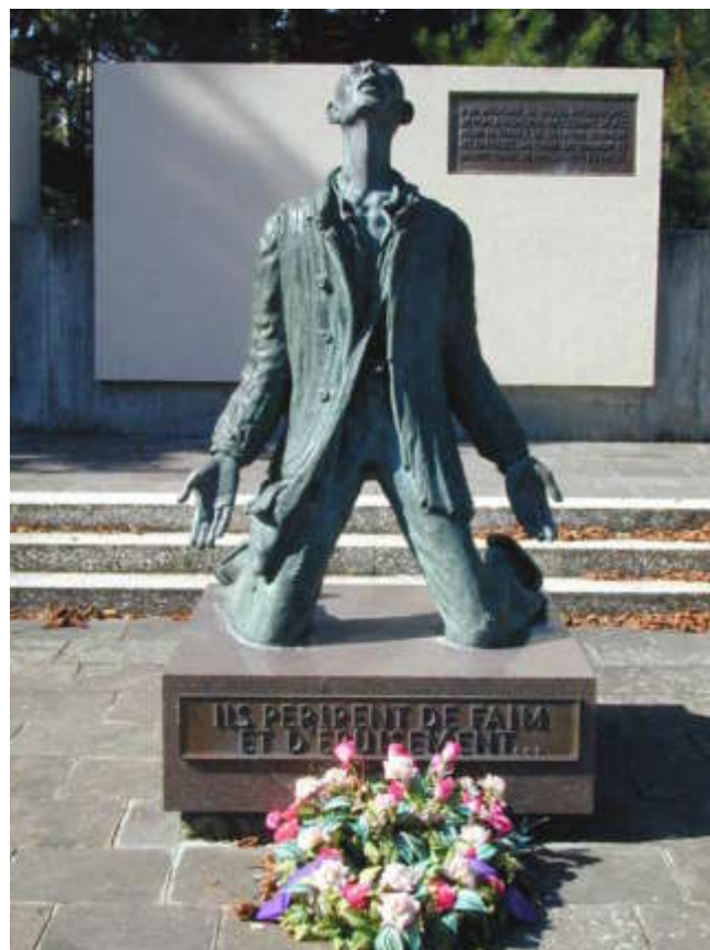
«Ils périrent de faim et d'épuisement...». Mémorial de Tambov à Mulhouse.

le Nord de la France. L'espoir grandit. Pendant trois semaines ensuite, il est complètement isolé de sa batterie avec quelques camarades, ne se nourrissant que de fruits cueillis sur place. Mais le repli vers l'Ouest continue. Le 24 juillet 1944, il envoie son dernier courrier par l'intermédiaire d'un permissionnaire dont le père venait de décéder. Il est alors toujours en Roumanie terré dans un bois, le front s'étant déplacé vers l'Ouest. «Yvan est très proche» écrit-il.