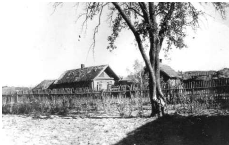
Habitations villageoises typiques de Russie.

Il est même appelé à maçonner une cuisinière de fortune avec des matériaux hétéroclites. Il est appelé souvent à des missions de reconnaissance avec les chevaux. La vie y est très dure, en raison du grand froid, de l'humidité, des conditions d'hébergement, du manque d'hygiène. Poux et puces les déman-